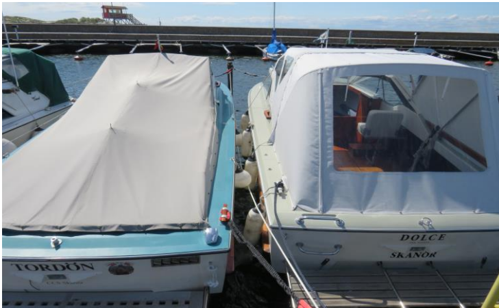
Platserna ska utnyttjas effektivt. Här är det med marginal

Det som gäller är att platsen är minst båtens bredd plus 3 dm. På bilden är det båtarnas platsbredd plus 3,5 dm.