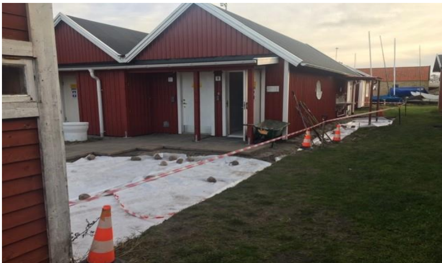
En ny gångväg byggs till diskstationen